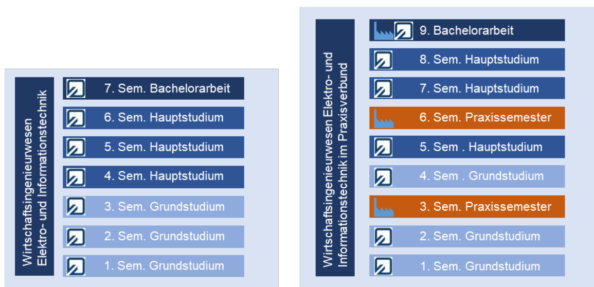
Abbildung 1: Aufbau der Studiengänge WEIT (links) und WEITiP (rechts; gültig für beide Varianten)

Insgesamt werden im Studium mindestens 210 ECTS-Leistungspunkte (LP bzw. Credit-Points) erworben, das sind pro Studiensemester im Schnitt 30 Leistungspunkte (LP).