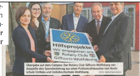
Übergabe auf dem Campus: Der Rotary Club Gifhorn-Wolfsburg verdoppelte den Spendenbetrag aus einer Podiumsdiskussion von Hochschule Ostfalia und Volkshochschule Wolfsburg.

ecke hinzu. Und Eisenbarth ergänzte: „Wir möchten mit dem Gold Kindern aus suchbelasteten Familien ermöglichen, an Aktivitäten teilzunehmen.“