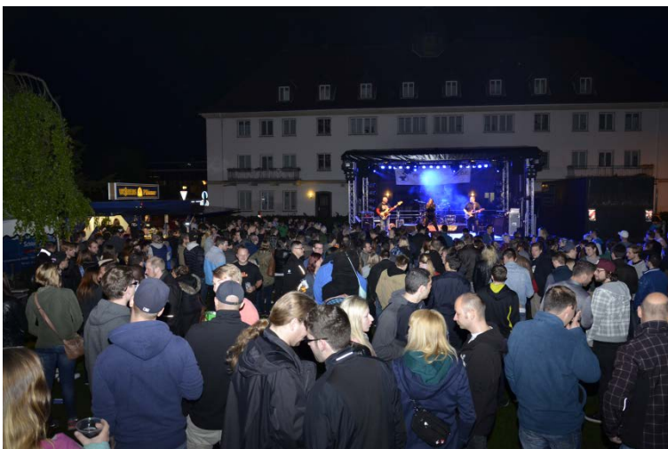
Gute Stimmung auch nach Sonnenuntergang.

Jedoch standen nicht unsere Alumni-Werbemaßnahmen im Vordergrund des Campus Open Air, sondern die Musik: